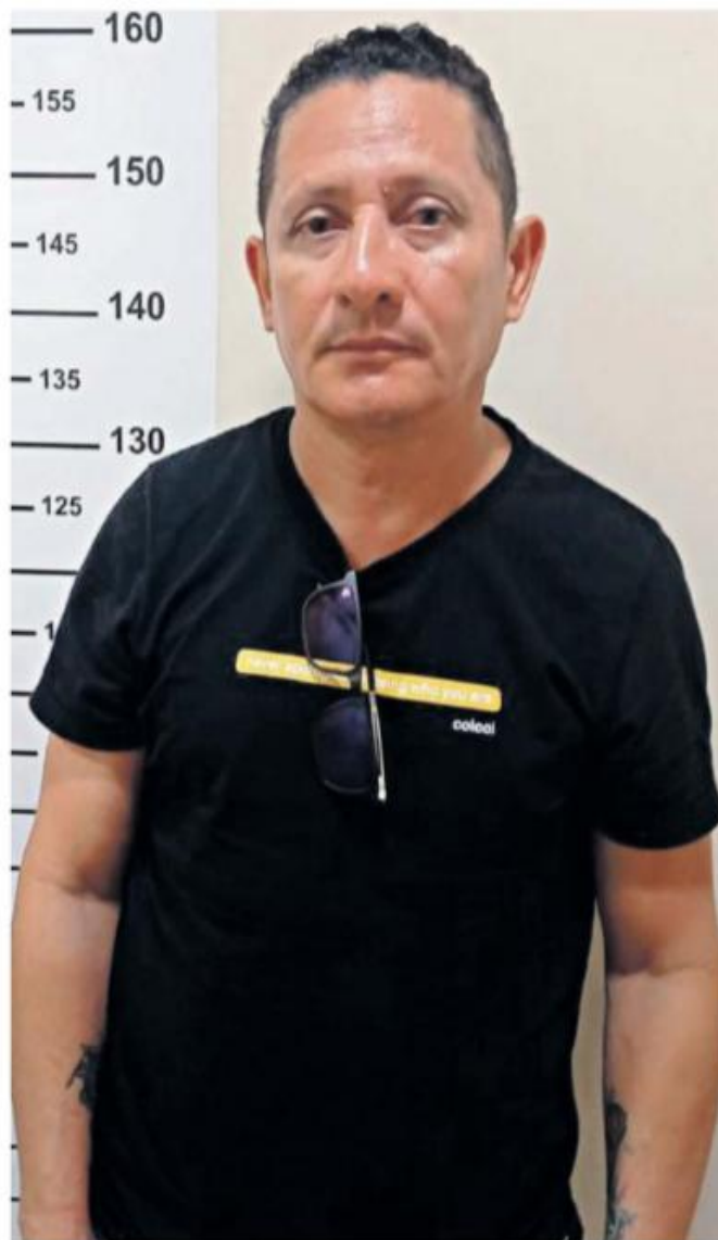
O criminoso tem uma extensa ficha com várias passagens pela polícia. Ele era procurado há quase dez anos

Após a condução do preso para a sede da Divisão Estadual de Narcóticos foi dado o cumprimento formal ao mandado de prisão, tendo em vista que a materialidade dos crimes do artigo 304 e artigo 306 do Código Penal demanda a realização de exame pericial no documento apresentado pelo preso.