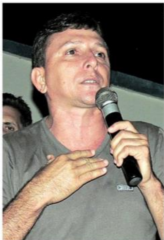
O prefeito Calça Curta: licitações montadas, a favor do próprio bolso

Os milhares de documentos apreendidos pelo MP nas secretarias municipais comprovaram irregularidades na montagem de processos licitatórios na administração municipal,