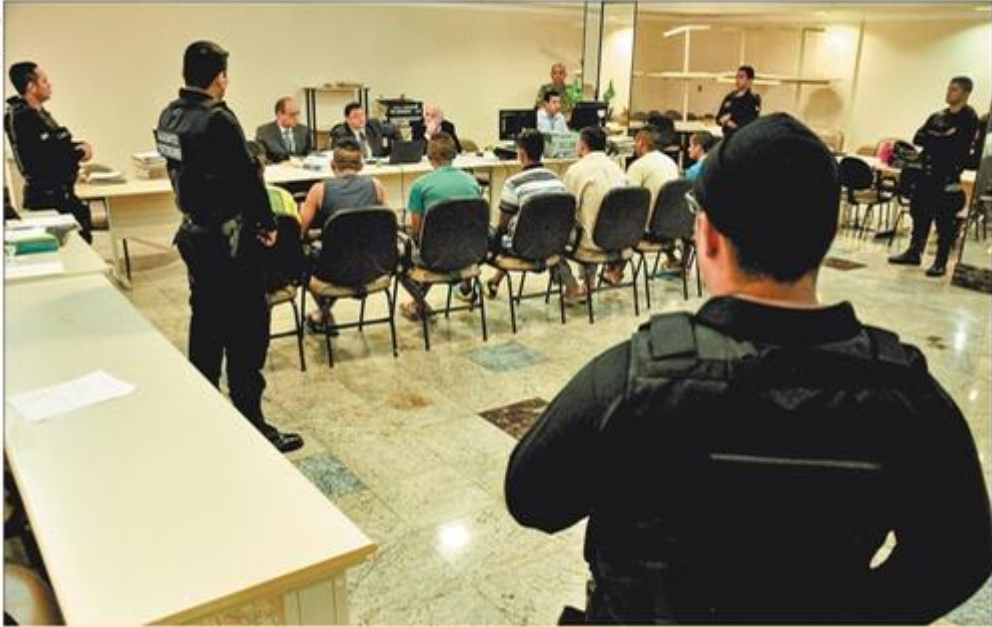
Mutirão promovido pelo TJPA em abril avaliou 3.700 processos e liberou 930 presos