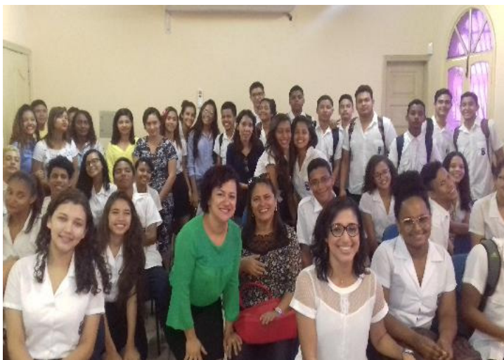
Foto 5 – Roda de conversa “Adolescência feminina em conflito com a lei na atualidade” - 2017.