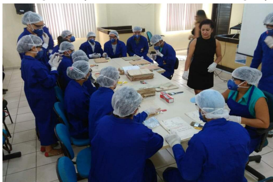
Foto 2 – Oficina de higienização de documentos em Bragança-PA - 2016