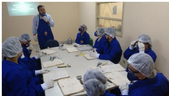
Foto 1 – Oficina de higienização de documentos em Belém-PA - 2016

As oficinas eram realizadas mensalmente e ministradas por professores, técnicos e outros profissionais parceiros do arquivo comprometidos com a valorização do patrimônio documental da Amazônia. Os temas eram voltados ao tratamento e à preservação do acervo documental histórico do judiciário. Assim, foram realizadas oficinas de higienização de documentos, documentação judicial como fonte de pesquisa e descrição arquivística. As oficinas eram realizadas em Belém, porém foi possível realizar uma de higienização de documentos na cidade de Bragança durante a programação da Semana Nacional de Arquivos organizada pelo curso de história da UFPA.