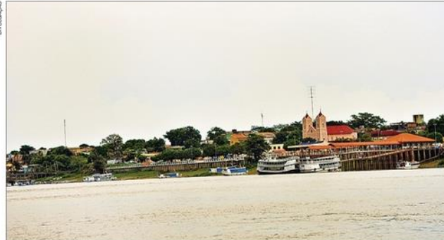
Populações ribeirinhas do Teles Pires reclamam dos impactos ambientais

A barragem é uma das sete projetadas pelo governo para o rio Teles Pires e fica a menos de um quilômetro de distância da terra indígena Kayabi, uma das afetadas. Por causa das obras, já foram detectados graves impactos nas aldeias que ficam na área