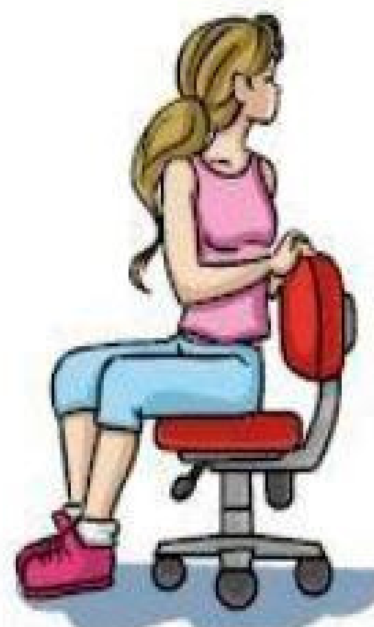
Rotação do tronco e do pescoço