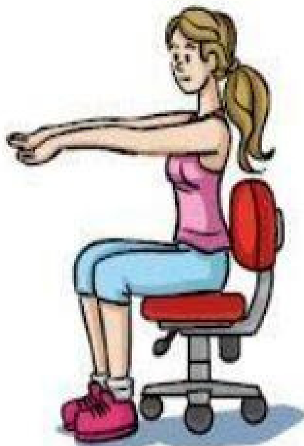
Extensão dos dedos e punhos (Abrir a palma da mão.)