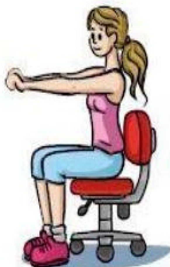
Flexão dos dedos (Fechar a mão.)