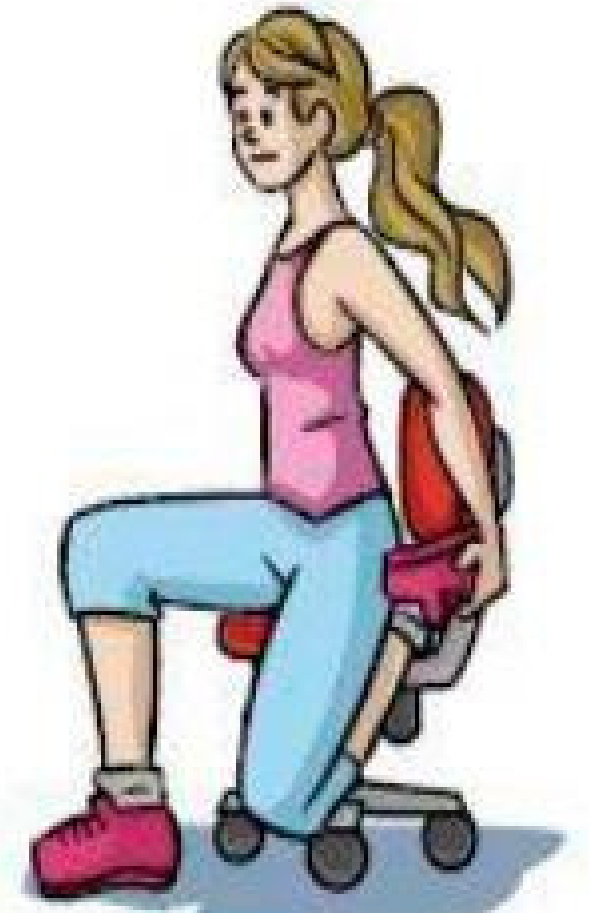
Flexão da perna e extensão da coxa