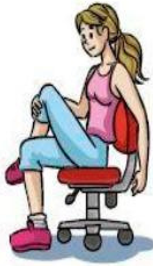
Adução e flexão da coxa