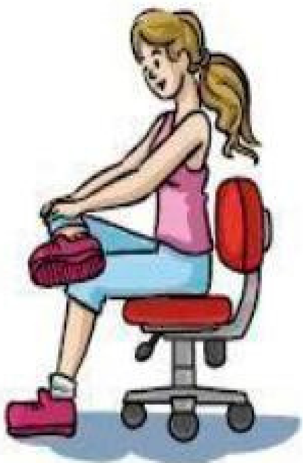
Abdução e rotação externa da coxa (Cruzar a perna.)