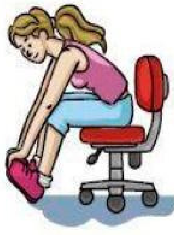
Flexão dorsal do pé