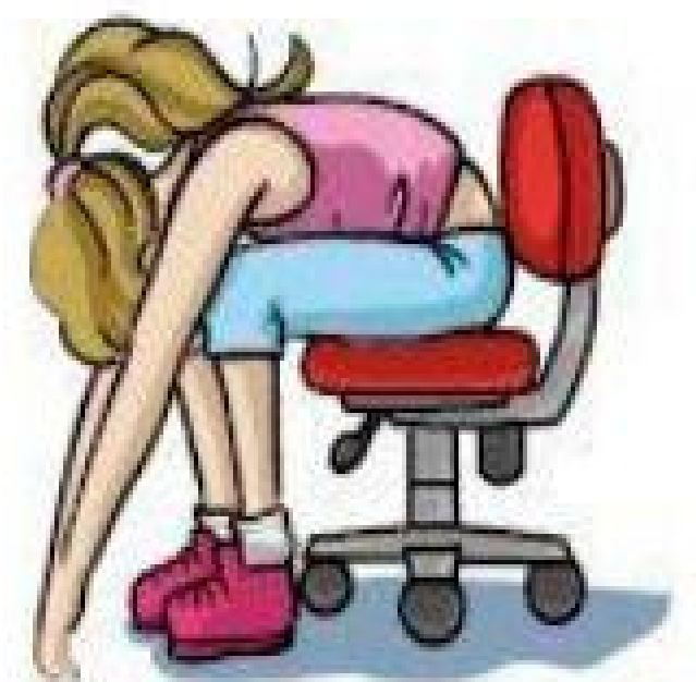
Flexão do tronco