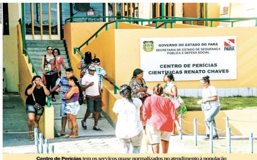
Centro de Perícias tem os serviços quase normalizados no atendimento à população

Durante os primeiros dias de greve, deflagrada no último dia 18, serviços essenciais como exames de lesão corporal mediante flagrantes, exames sexológicos, dosagem alcoólica, constatação de drogas, necropsias, remoção e liberação de cadáveres e local de crime contra a vida mantiveram-se normais, como garante a direção do CPC. A Aspop dis-