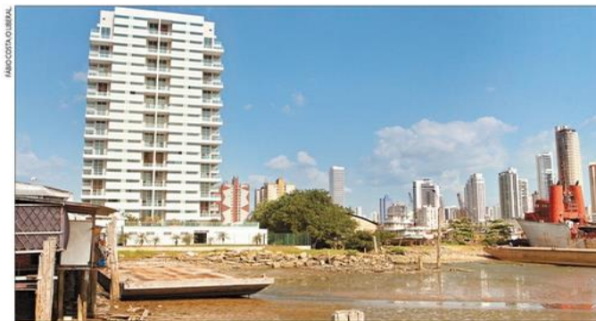
Edifício Premium será avaliado por comissão de peritos nomeada por juiz federal