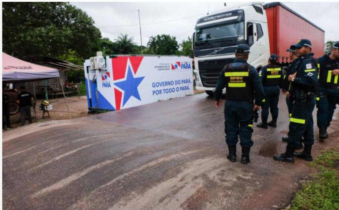
📷 Associações reclamam contra medidas de isolamento social | Agência Pará

As associações dos Taxistas de Mocajuba (ATM) e dos Mototaxistas de Mocajuba (Amotaxi) estão proibidas de obstruir a Rodovia PA-151, durante o período de vigência dos Decretos Municipais nº 036-2020, e 046-2020, do Município de Baião, os quais disciplinam as medidas de controle sanitário e em especial o controle do fluxo de entrada e saída de pessoas da cidade de Baião. A determinação é do juiz Ednaldo Antunes Vieira, titular da Vara Única da