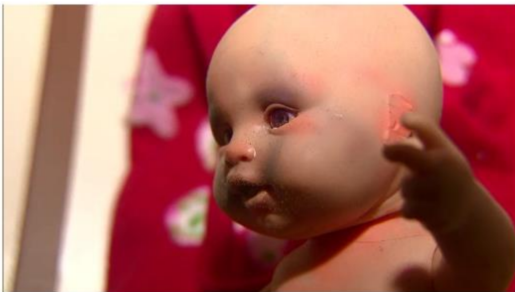
TJPA alerta para abuso sexual à criança no período de isolamento social provocada pela Covid-19

O Tribunal de Justiça do Pará alerta para os casos de violência sexual e maus tratos contra crianças e adolescentes durante o período de isolamento social devido a pandemia do novo coronavírus (Sars-CoV-2).