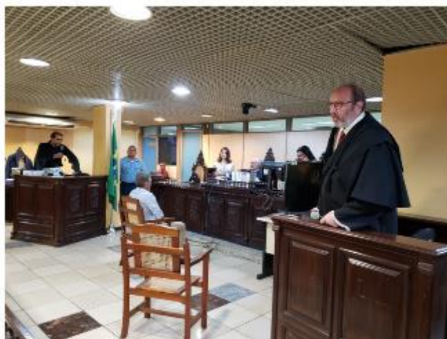
Sessão foi adiada pela promotoria.

Os atendimentos presenciais no Tribunal de Justiça do Pará estão suspensos até o dia 30 de abril.