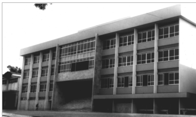
Primeira sede própria do TJE-PA

Aprovada a Constituição Estadual de 8 de julho de 1947, o TRIBUNAL DE APELAÇÃO passou a denominar-se TRIBUNAL DE JUSTIÇA formado por dez desembargadores, sendo o Presidente e demais órgãos de direção eleitos pelo próprio Tribunal. A partir de 8 de março de 1954, através da Lei nº 761 , foi criado o cargo de CORREGEDOR GERAL DA JUSTIÇA .