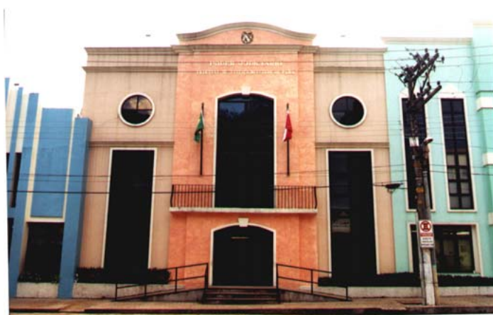
Nova Sede do TJE-PA 2002

Instituindo a Medalha Comemorativa ao Dia do Judiciário Paraense “MÉRITO DESEMBARGADOR HERMANO RODRIGUES DO COUTO” , através da RESOLUÇÃO 009/2002, em homenagem a seu primeiro presidente, o Tribunal de Justiça do Estado do Pará, busca laurear personalidades que “tenham contribuído direta ou indiretamente para o engrandecimento do Estado do Pará e particularmente do Poder Judiciário”.