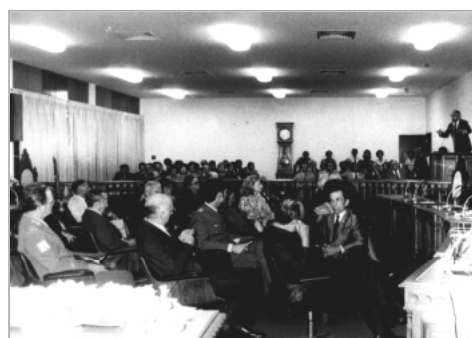
Antigo Plenário do Tribunal de Justiça do Estado do Pará