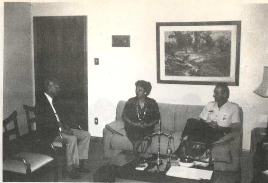
O Major-Brigadeiro-do-Ar Flávio Peterson, comandante do 1º Comando Aéreo Regional, em visita oficial ao TJE/PA, no dia 16 de junho último.