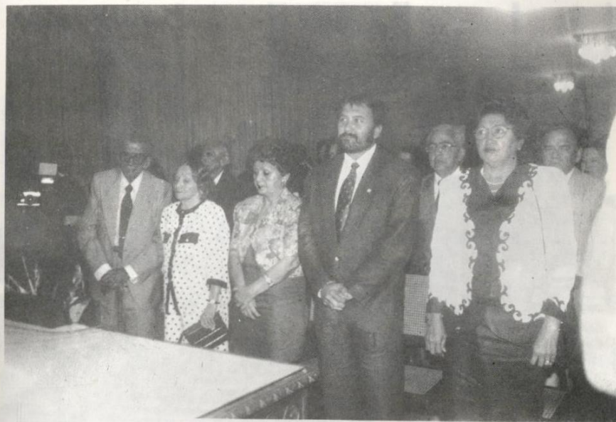
Aspecto da sessão solene de 30 de abril, que contou com a presença do prefeito de Belém, Augusto Rezende.