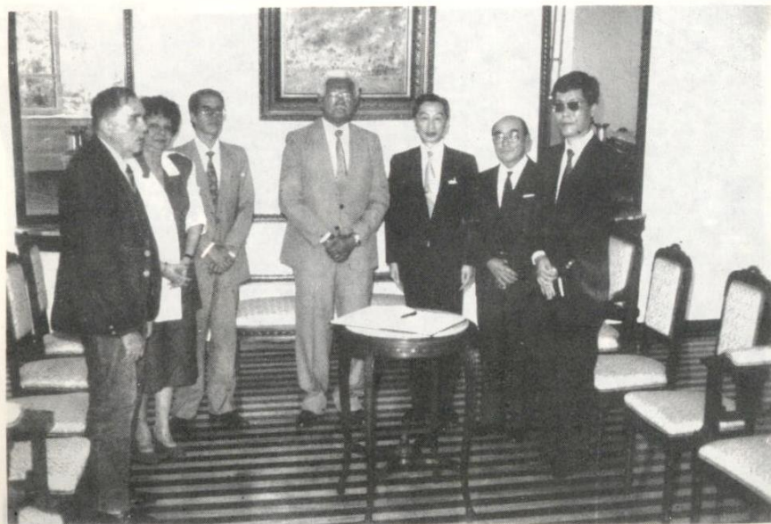
O Embaixador Extraordinário e Plenipotenciário do Japão no Brasil, Yassushi Murazum, esteve no TJE/PA em 22 de maio, em visita oficial.