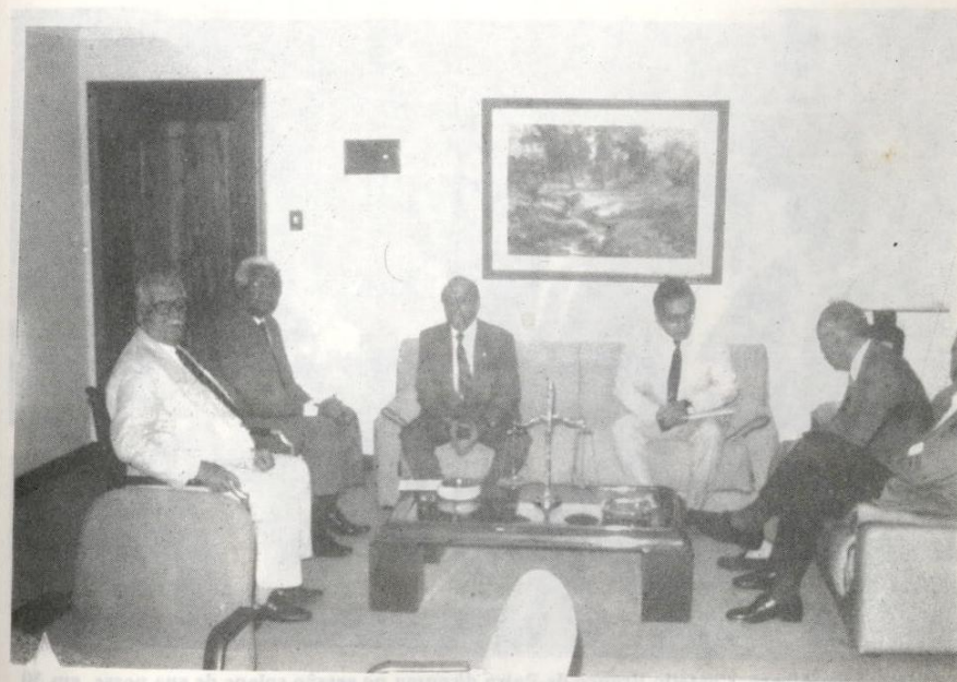
Nabil El Hosny, Governador do Rotary Clube Internacional, visitou o TJE/PA em 13 de abril último.