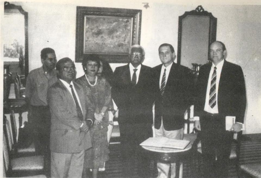
Em 9 de abril deste ano, Jorge Bolanos, Embaixador Extraordinário e Plenipotenciário de Cuba no Brasil, esteve no TJE/PA, sendo recebido pelo Des. Nelson Silvestre Rodrigues Amorim, presidente do Tribunal.

proporcionando aos usuários maiores facilidades de utilização do acervo. Para tanto, foram expedidos, aos diretores de Foruns das comarcas do interior, questionários, que servirão de subsídio para a reestruturação.