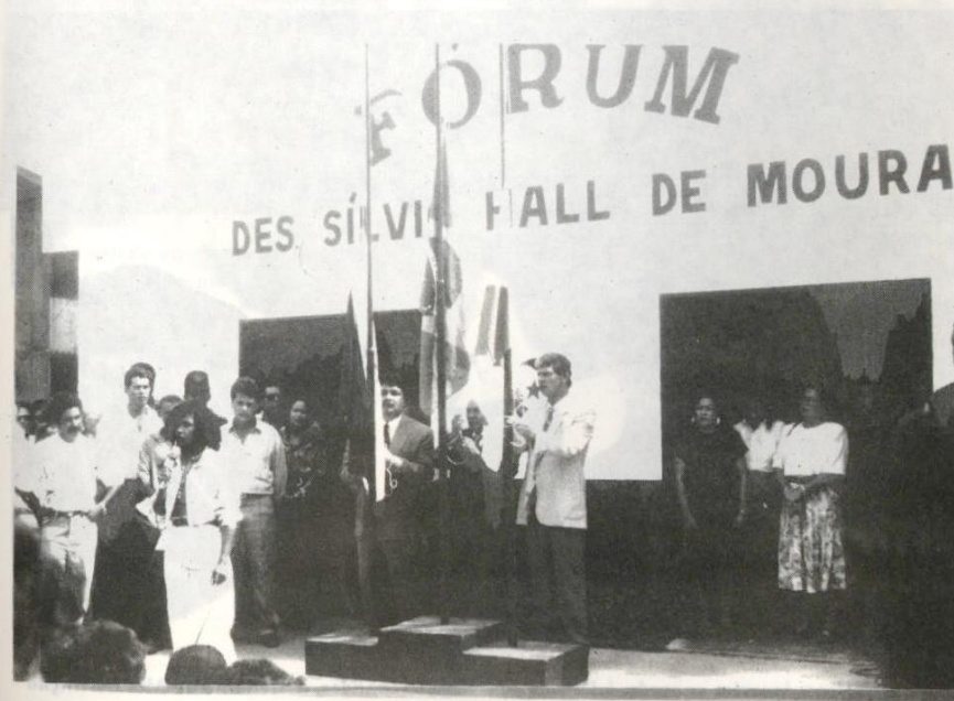
Hasteamento das bandeiras na instalação da Comarca de Uruará, em 27 de junho.