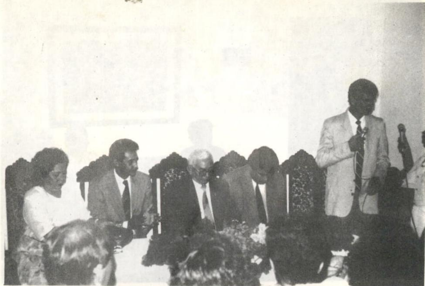
Aspecto da sessão solene de instalação da Comarca de Uruará.